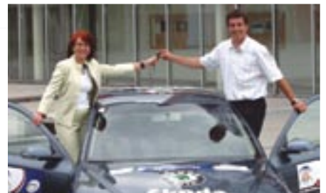
Zu den Sponsoren der WM 2006 gehört Skoda, die ersten Autos wurden bereits übergeben Seite 9