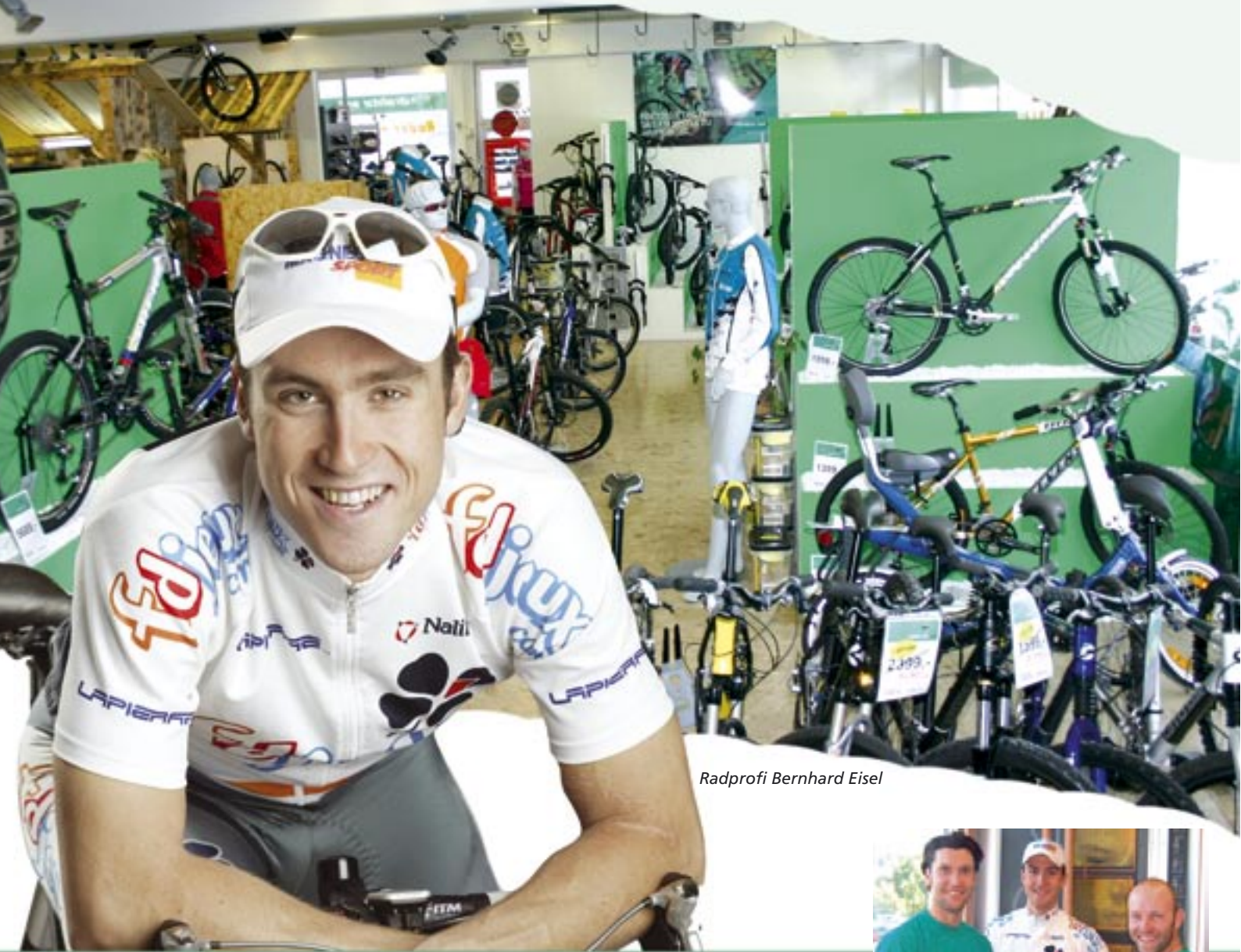
Radprofi Bernhard Eisel