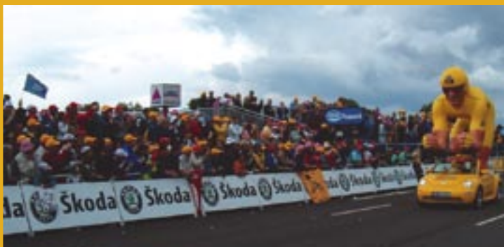
Die Werbekarawane bei der Tour de France ist auf jeder Etappe ein besonderer optischer Leckerbissen. Auch für Salzburg ist geplant, einige attraktiv gestaltete Fahrzeuge über die Strecke zu schicken.

Ein besonderes Anliegen ist für den Salzburger OK-Generalsekretär, der heimischen Bevölkerung die Größenordnung einer Radveranstaltung wie sie die WM darstellt zu verdeutlichen – inklusive des Werbe- und Wirtschaftsfaktors. Die Berechnungen in Baden-Württemberg: Jeder investierte Euro wird rund zehnfach wieder eingenommen. Das Radpublikum gilt als sehr spendabel. Weiss: „Jetzt liegt es an uns, für Österreichs größte mobile Sportveranstaltung aller Zeiten die richtige Stimmung zu erzeugen, zum Glück helfen uns die starken Leistungen unserer Profis.“